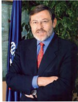
Jaime Lissavetzky Díez